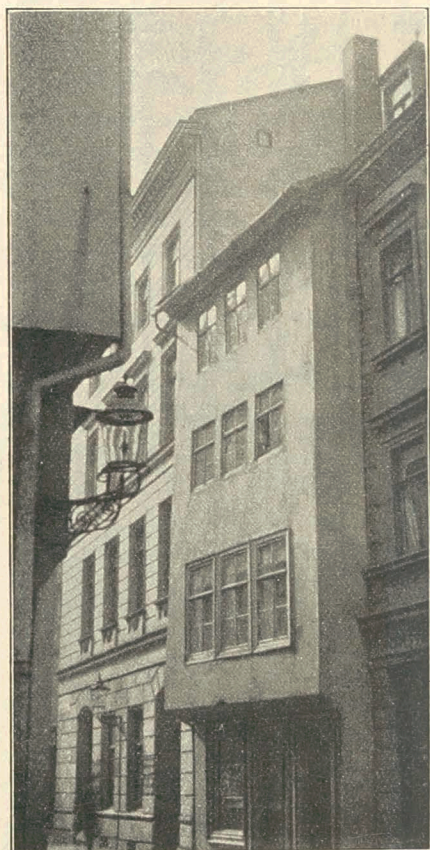
J. G. Georgis Haus in Halle a. S., Kl. Klausstr. 1.

glaubt jedoch nicht fehl zu gehen, wenn er annimmt, daß Friedemann von Anfang an bis 1763 in dem Hause seines späteren Schwiegervaters, des Akziseeinnehmers Joh. Gotthilf Georgi, gewohnt hat (Siehe Abbildung). Dieses Haus war