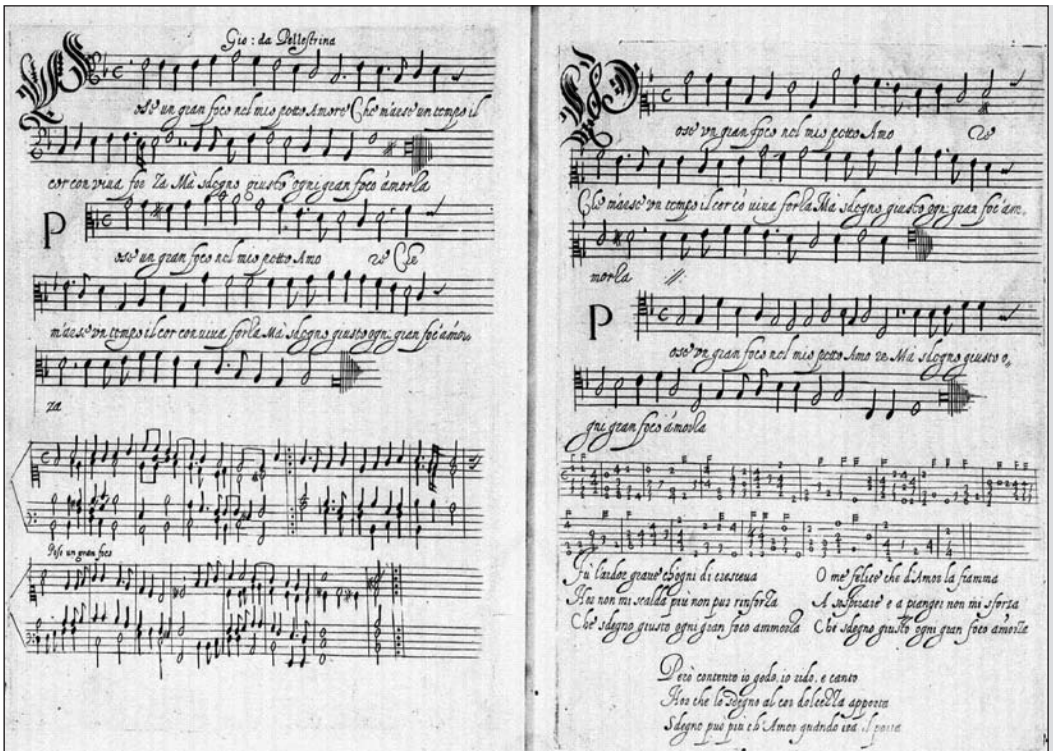
3 Giovanni Pierluigi da Palestrina, „Pose un gran foco“, aus Simone Verovio, Canzonette a quattro voci (Rom, 1591 12 ), GB-Lbl, K.8.h.23.

Bearbeitungen von Vokalmusik enthalten, lassen sich durch die Angaben zu enthaltenen Werken nun wesentlich leichter Konkordanzen bestimmen. Auf dieser Basis lässt sich der Prozess aufdecken, in dem Vokalwerke für Soloinstrumente adaptiert wurden.