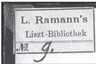
3 Aufgeklebtes Etikett vom Antiporta mit Nummer des Ramann-Verzeichnisses