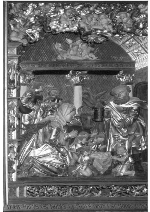
Abb. 2: Annaberg-Buchholz, Annenkirche, Bergaltar . Schrein , 1521, Geburt Christi mit musizierenden Engeln am Himmel; ein Hirte mit Sackpfeife.