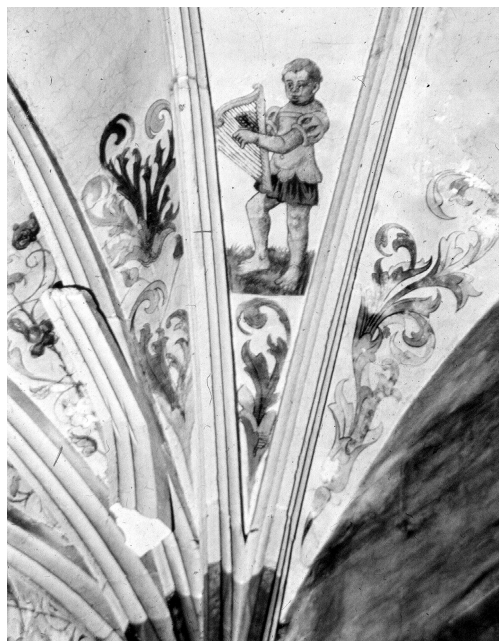
Abb. 5: Pirna, Stadtkirche, Deckenmalerei von Jobst Dorndorf, 1544–46, Harfe spielender Mann.