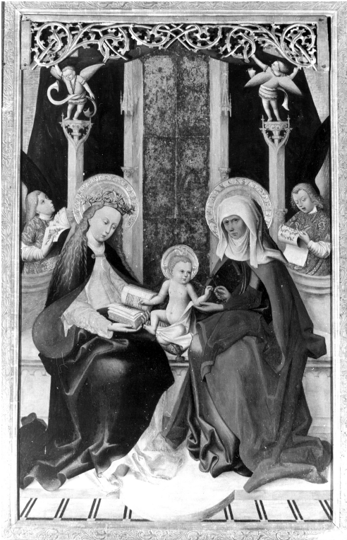
Abb. 1: Burg Gndandstein, Burgkapelle, Altarschrein um 1503, Anna selbdritt mit singenden Engeln.