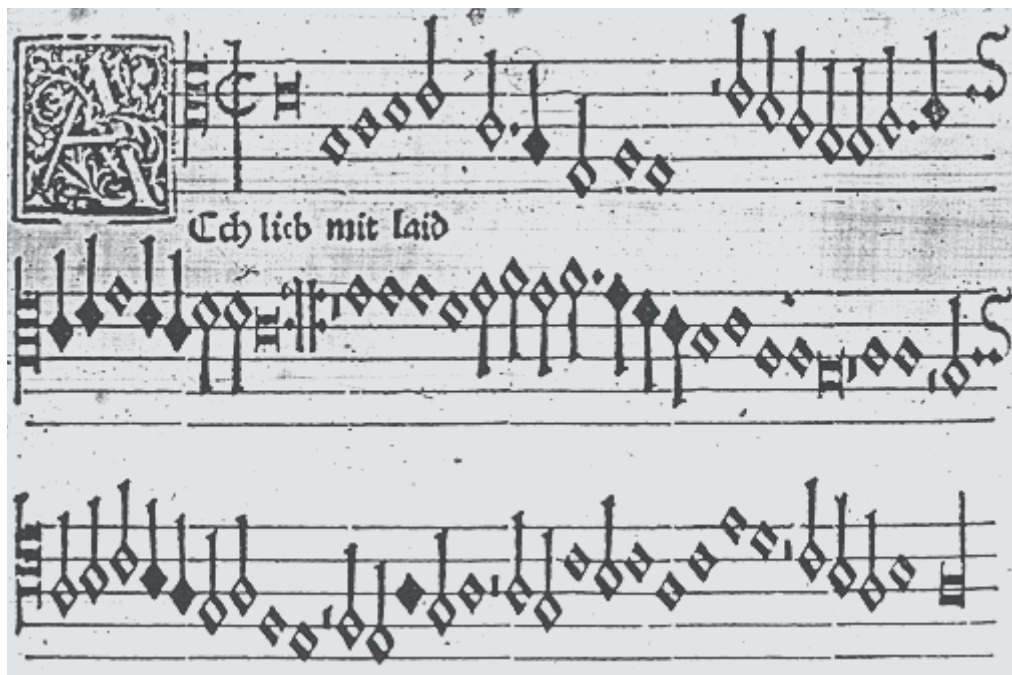
Abb. 4: Paul Hofhaimer, Ach lieb mit laid , Tenorstimme aus Oeglin's erstem Liederbuch (1512), Nr. 6, fol. [A v]v (die 12. Note im 3. System ist irrtümlich geschwärzt).

Auch in Hofhaimers unterdessen „uraltem“ 49 Lied des so genannten Hofweistentyps Ach lieb mit laid , in dem die Trostlosigkeit des klagenden Liebhabers im Original der Freudlosigkeit der Welt parallel gesetzt wird, die aber im Verlauf von sieben Kontrafaktur-Strophen zum Trost durch Christi Erlösungstod umgemünzt wird, ist diese Umfunktionalisierung an den Verkürzungen erkennbar (siehe Abbildung 3 und 4). 50 Doch ansonsten wird die ursprüngliche, komponierte Melodie nicht liedhaft vereinfacht, sondern bleibt auch beim einstimmigen Singen in ihrer polyphonen Zurichtung erhalten: mit allen Ornamentierungen, Melismen und Synkopen. Der mehrstimmige Satz wird mitgedacht oder ist zum Wenigsten virtuell präsent; die Liedmelodie trägt ihn wie einen Nucleus in sich und repräsentiert ihn.