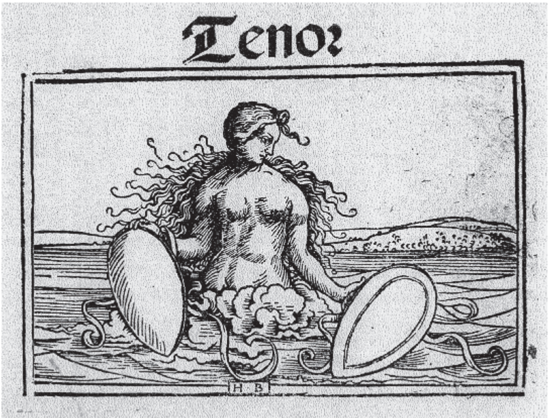
Abb. 1: Erstes Liederbuch von Erhard Oeglin, Augsburg 1512, Titelblatt des Tenor-Stimmbuchs.

bewusst sucht. 18 Doch über diese vertraute atmosphärische Vibration hinaus ist es das Textelement der Rosen, das als gedankliche Verbindung wirkt. In der weltlichen Lyrik, wie auch hier, galt die Rose als Liebes- und Koitussymbol. Doch da die Rose dem Mythos nach aus demselben Schaum entstanden ist wie Aphrodite, die „Schaum-Geborene“, war sie das Sinnbild leidenschaftlicher Liebe generell und konnte so in der christlichen Tradition in die Mariensymbolik mit der gerade spiegelbildlichen Konnotation der Virginität und vollkommenen Liebe übergehen. 19