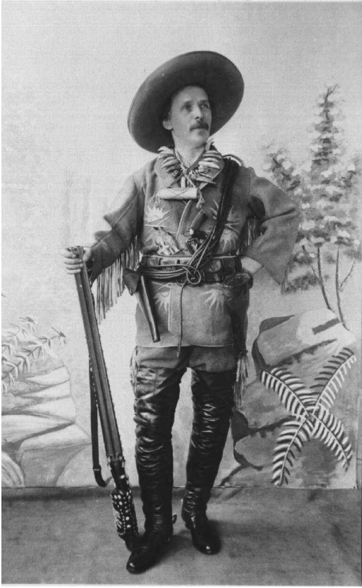
Abbildung 1: Karl May als Old Shatterhand, Fotografie (1896)