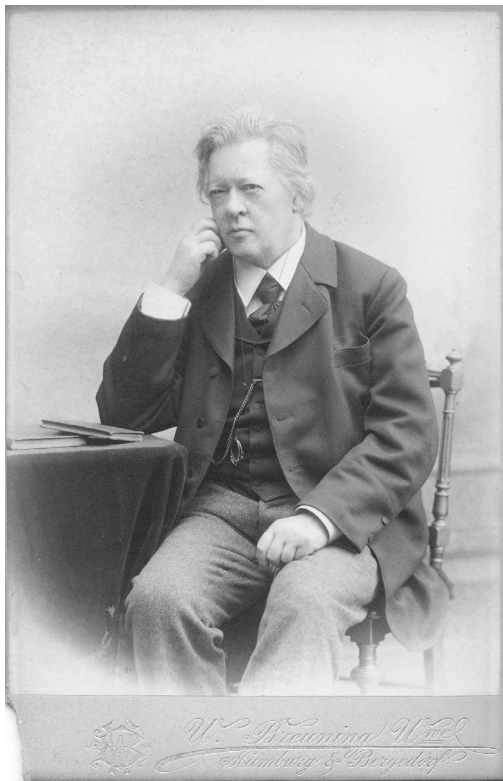
Theodor Kirchner 1895

Im Jahr 1891 hat Max Reger seine zweite Violinsonate in D-Dur op. 3 „Herrn Theodor Kirchner“ gewidmet. Eine doch erstaunliche Widmung, da Reger – wie auch jeder andere Komponist – in aller Regel ein Werk nur demjenigen widmet, den er persönlich kennt, der in künstlerischer oder gesellschaftlicher Hinsicht eine herausragende Position bekleidet, der für den Komponisten ein Idol darstellt oder der dem Komponisten schlichtweg zu etwas nutze sein kann. Bei Theodor Kirchner trifft das alles kaum zu: Reger war mit dem um genau 50 Jahre älteren Kirchner (1823–1903) nicht bekannt und allem Anschein nach bestand niemals ein persönlicher Kontakt zwischen den beiden, Kirchner hatte zur Zeit der Widmung seinen Zenit als Künstler schon weit überschritten, Macht und Einfluss hatte er genauso wenig wie Geld. So bleibt zu vermuten, dass Reger in Kirchner ein Idol gesehen hat, in dem er zumindest einen Teil seiner musikästhetischen Positionen verkörpert sah. Die Widmung an Kirchner galt ihm wohl als Repräsentanten der Traditionslinie Mendelssohn–Schumann–Brahms, in