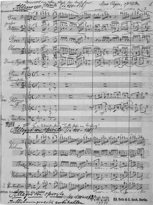
Der Anfang des Konzerts im alten Stil op. 123

sehen Concerten nicht mehr ‚gebaut‘ worden ist – also fast 200 Jahre sozusagen ‚verloren‘ war.“ 6 Regers kompositorische Meiningener Periode beginnt also mit der Initiation von Neuem in der Besinnung auf Altes. Durch die Widmung an den Herzog erhebt Reger dies zu seinem neuen Programm und trifft damit gleichermaßen das Credo des greisen Regenten und Widmungsträgers: Aus dem lebendigen Boden der Vergangenheit wächst ein neues Kunstwerk für die Gegenwart. Reger montiert in dem neuen Werk zwei Zeit- und Stilebenen, indem er die vertikalen Säulen barocker Kadenzformeln benutzt, diese aber in für ihn typischer Durchgangsharmonik aufweicht und überhöht. Dabei werden diese raffinierten klanglichen Effekte mit einem bemerkenswert kleinen Orchesterapparat erzielt – ganz im Gegensatz zu Regers früheren, als überfrachtet kritisierten Orchesterpartituren. Aber der Dirigent wollte ja gerade von seiner beinahe täglichen Meiningener Orchester-Werkstattarbeit als Komponist profitieren und hat immer wieder betont, wie sehr die Arbeit mit einem vergleichsweise kleinen Orchester von 52 Musikern zur Durchsichtigkeit seiner Partituren beigetragen hat. Der Rückgriff auf Bach und Händel, „der Zug des Vereinnahmens, Sich-Ein-