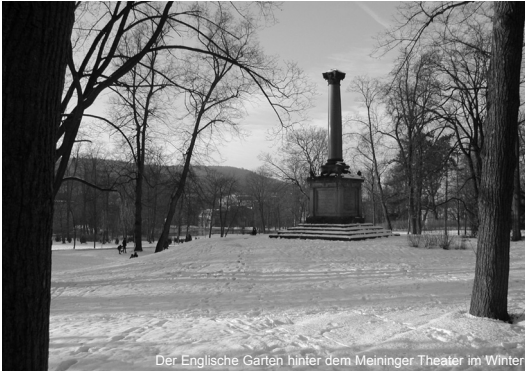
Der Englische Garten hinter dem Meininger Theater im Winter

Hans Pfitzners – sein Œuvre weit im Voraus konzipierte und (hierin Richard Strauss vergleichbar) auf Knopfdruck zu schreiben vermochte. Der Auslöser und Anlass für die Hinwendung nach Meiningen lässt sich tatsächlich als Wendepunkt in Regers Biographie festmachen in einer Kongruenz aus Zufall und Schicksal: Das unerwartete Angebot von der Meininger Hofkapelle kam genau zu dem Zeitpunkt, da Reger seiner bisherigen Tätigkeit überdrüssig wurde. Ausschlaggebend hierfür war das