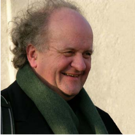
Wolfgang Rihm

Wir gratulieren dem Präsidenten der Internationalen Max-Reger-Gesellschaft e.V. zu seinem 60. Geburtstag!