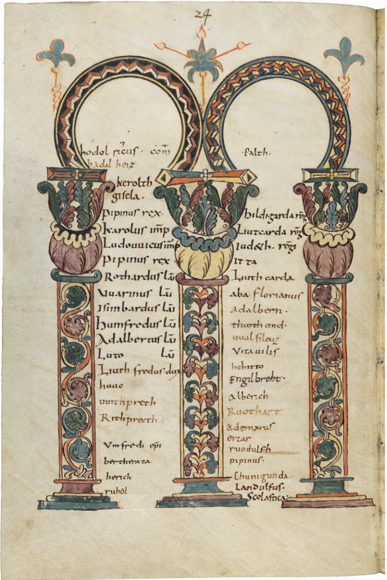
Abb. 1: Liber viventium Fabariensis, pag. 24 und 25.