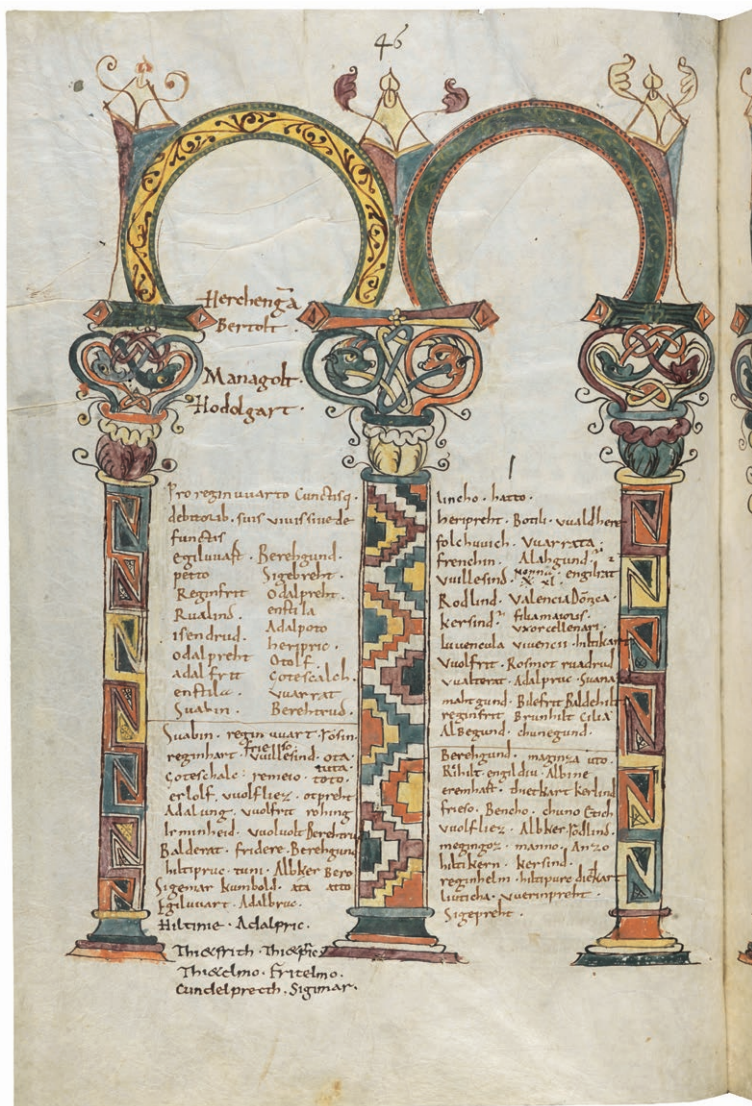
Abb. 5: Liber viventium Fabariensis, pag. 46.