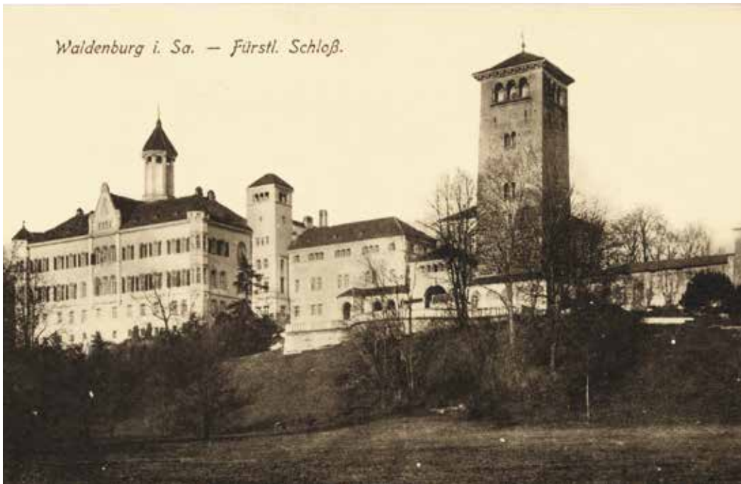
Das Schloss in Waldenburg wurde 1909 bis 1912 aufwendig umgebaut. Bis 1945 war die Sparkasse im Schlossturm untergebracht, dem Bergfried der mittelalterlichen Burg.