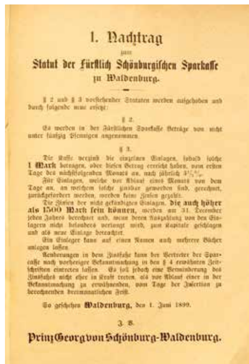
Nachtrag zum Statut der Fürstlichen Sparkasse Waldenburg vom 1. Juni 1899

satz zu anderen deutschen Einzelstaaten gerade nicht als großstädtisches Phänomen begann. Königsbrück und Waldenburg jedenfalls stehen als Beispiele für regional bezogene Einzelinitiativen zweier am Gemeinwohl orientierter Persönlichkeiten und damit zugleich auch für die engen Verbindungen zwischen sächsischer Sparkassen-, Wirtschafts- und Sozialgeschichte. Heute, 200 Jahre nach diesen wegweisenden Gründungen, tritt deren Bedeutung umso klarer hervor, als sich das sächsische Sparkassenwesen längst zu einem gesamtgesellschaftlich unverzichtbaren Faktor weiterentwickelt hat.