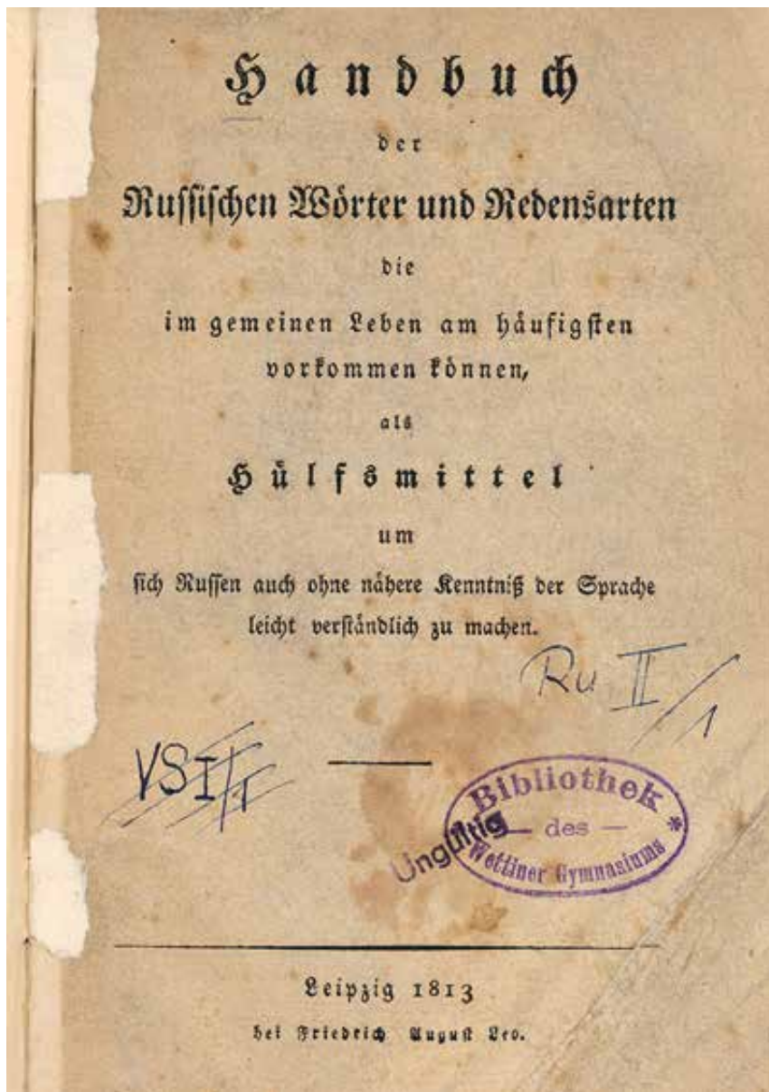
Handbuch der Russischen Wörter und Redensarten von Johann Adolph Erdmann Schmidt, 1813