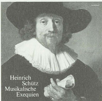
Heinrich Schütz Musikalische Exequien