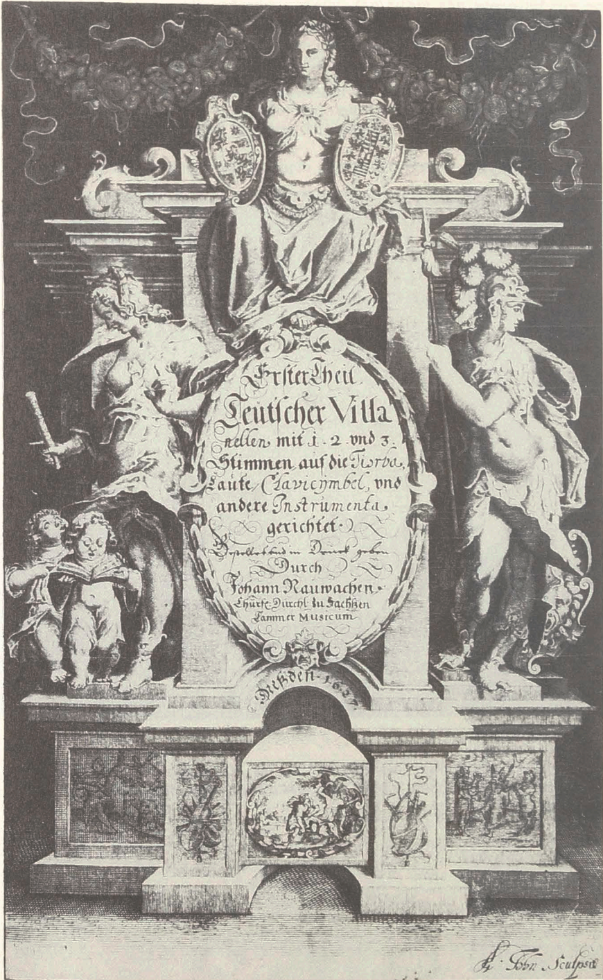
Abbildung 2: Johann Nauwach, Erster Theil Teutscher Villanellen, Dresden 1627, Kupfertitel von August John (zu SJb 7/8, S. 53)