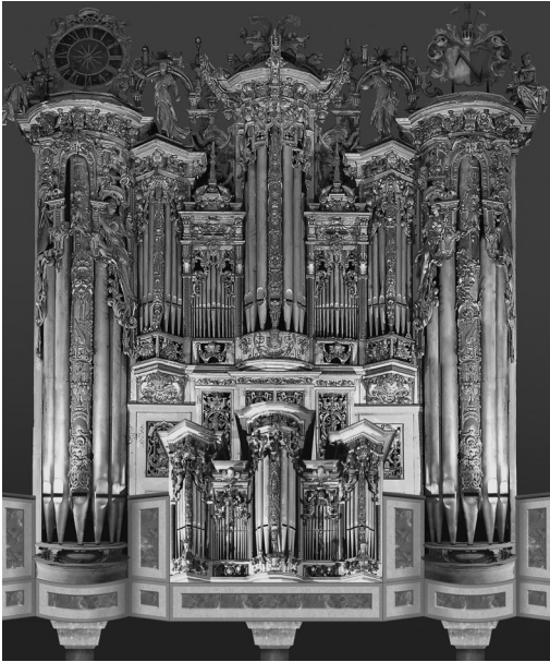
Abbildung 6: Beck-Orgel Gröningen/Halberstadt Rekonstruktion des Prospekts der Beck-Orgel in Gröningen. Fotomontage der Aufnahmen des Prospekts der Martini-Orgel in Halberstadt und des Rückpositivs, das in Harsleben erhalten ist.

das auf den fachmännischen Rat von Reineccius zurückgreifen konnte, der just in dieser Zeit seine Historia Julia sive syntagma heroicum (Helmstedt 1594–1597) redigierte. Heroische Bezüge der klassischen Antike sind es dann auch, die vor christlicher Symbolik den Vorrang (etwa am Orgelprospekt) aufweisen 185 . Bekanntlich hat sich Praetorius im ersten Band des Syntagma musicum darum bemüht 186 ,