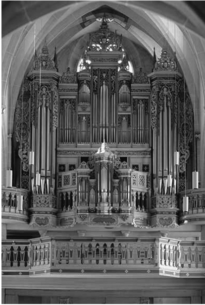
Abbildung 3: Compenius-Orgel der Prediger-Kirche Erfurt

Das (leicht veränderte) Gehäuse des Oberwerks stellt wahrscheinlich den einzigen erhaltenen Original-Prospekt von Heinrich Cumpenius dem Älteren (1572/79) dar. Die Rundtürmchen des Oberwerks und das Rückpositiv-Gehäuse stammen von seinem Enkel Ludwig Compenius (1648). Das Werk ist modern und wurde 1978 von der Fa. Orgelbau Schuke Potsdam gebaut (Foto: Matthias Frank Schmidt, Erfurt. Reproduktion mit Erlaubnis der Ev. Predigergemeinde Erfurt).