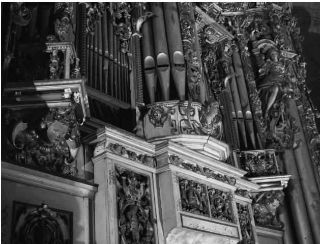
Abbildung 7: Prospekt-Detail der Beck-Orgel Gröningen/Halberstadt. Das Brustwerk und der Rundturm des Oberwerks mit ihrem komplexen Dekor sind zu erkennen (Foto und Reproduktionserlaubnis: Jean-Charles Ablitzer, Belfort).

Alles in allem stellt die Gröninger Schlossorgel den Höhe- und Schlusspunkt der mitteldeutschen Renaissance-Orgel dar und bildet gleichzeitig den Ausgangspunkt zur norddeutsch geprägten Orgel des Frühbarock.