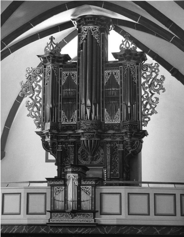
Abbildung 6: Prospekt der Wagner-Orgel in der Markuskirche in Butzbach (Hessen) von 1614

Erhalten haben sich in folgenden Städten bzw. Kirchen Prospekte von Orgeln Georg Wagners: