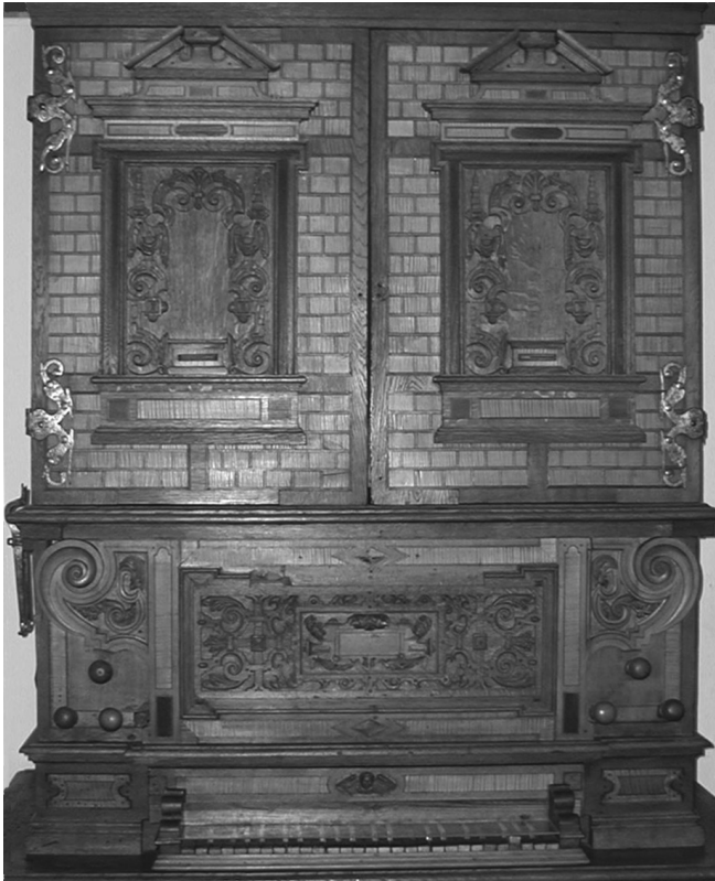
Abbildung 5: Die geschlossene Vorderfront der Marburger Schlossorgel mit ihrem Einlege- und Schnitz-Dekor. Die mit floralen Motiven verbundenen Schnitzereien im Floris-Stil müssen von einem Kunstschreiner stammen