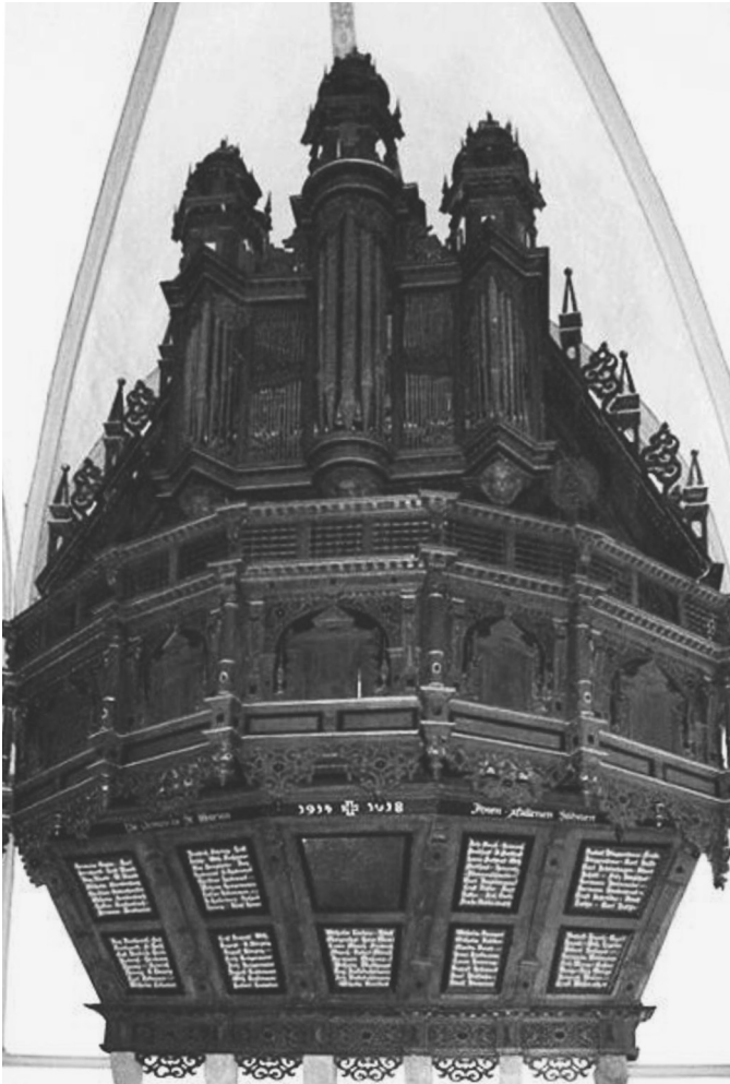
Abbildung 2: Die Slegel-Scherer-Orgel in St. Marien, Lemgo. Die Kasseler Schloss-Orgel dürfte diesem Werk ähnlich gewesen sein.

einen Neubau in der Stadtkirche von Immenhausen begonnen und einen weiteren Orgelbau-Vertrag mit der Stadt Hofgeismar abgeschlossen 47 , der aber am Widerstand des Superintendenten scheiterte. Offenbar vermuteten die Scherers ein Intrige Weislands, der nach dem Abschluss der Fuldaer Arbeiten einen Neubauvertrag mit dem Würzburger Domkapitel geschlossen hatte 48 .