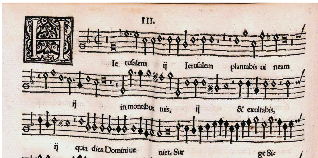
Bild 2. München, Bayerische Staatsbibliothek, Digitale Sammlungen, 4 Mus.pr 165#Beibd.1. Orlando di Lasso, Sacrae Cantiones quinque vocum (Nürnberg, 1562). Hierusalem plantabis vineam , inicio del discantus.