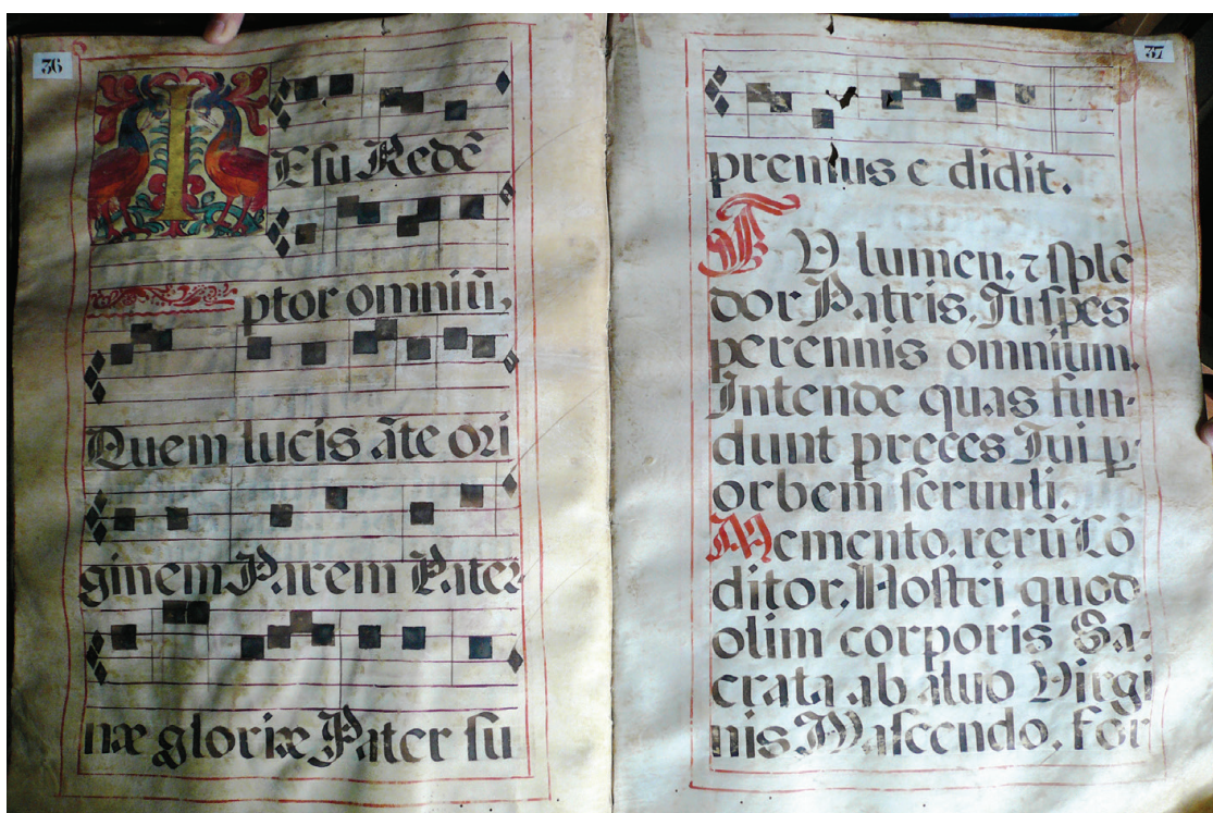
Bild 4. AHAG, Cabildo, Música, himnario en canto llano (Inventar-Nr. 1-5-1-126), pp. 36-37. Melodie im 8. Ton für den Hymnus Redemptor omnium .