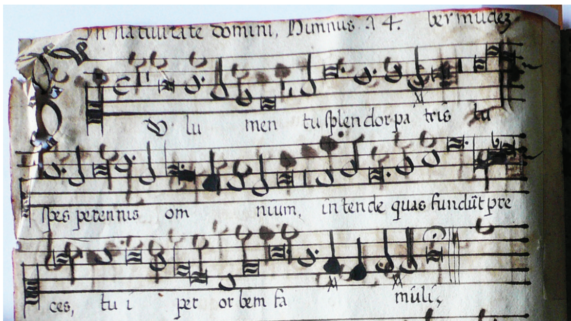
Bild 3. AHAG, Cabildo, Música, Libro de polifonía 2-A f. 3v. Tu lumen, Tu splendor Patris , 2. Strophe des Hymnus Christe redemptor omnium von Pedro Bermúdez, tiple(?).